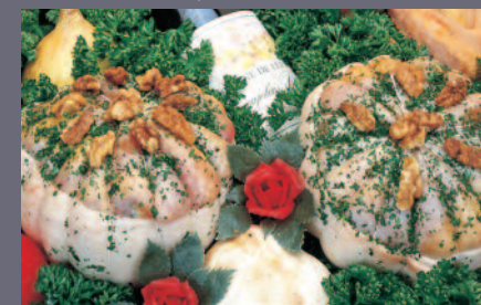
Melon de Pintade aux Noix ou Noisettes