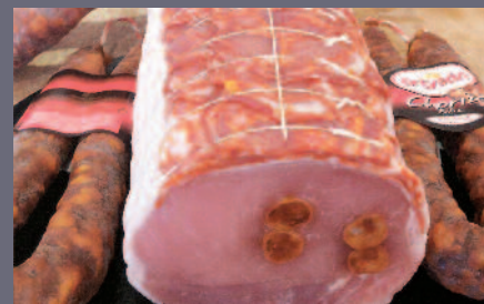
Rôti de Porc au Chorizo