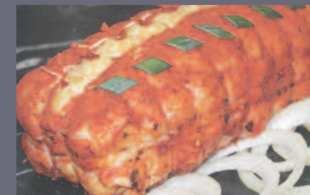
Magret de Canard aux Piments d'espelette