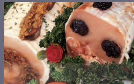
Rôti de Porc aux Fruits Secs