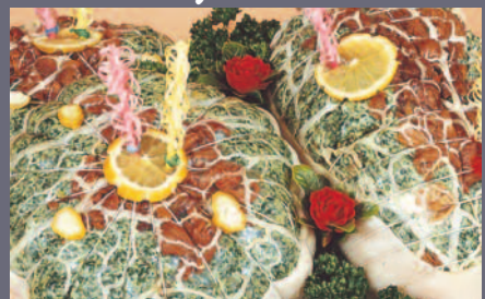
Gigot d'Agneau Cavaillon