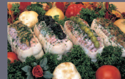
Rôtis de Dinde Farcis