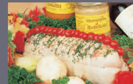
Rôti de Chapon aux Fruits