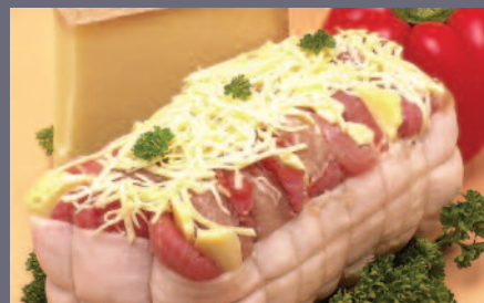
Rôti de Veau Orloff