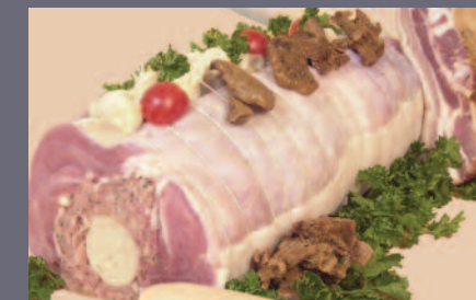
Giglette de Dinde au Boudin Blanc