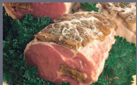
Rôti d'Agneau aux Fruits Secs