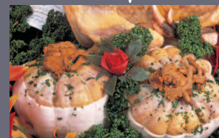
Melon de Pintade aux Girolles