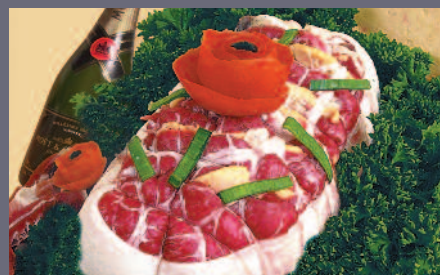
Feuilleté de Bœuf (foie gras et magret fumé)