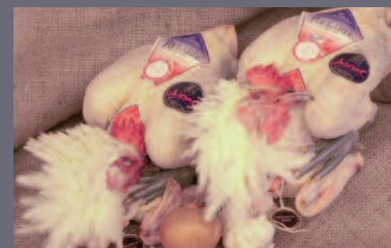
Volailles de Bresse