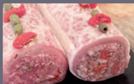
Rôti de Veau à la Provençale