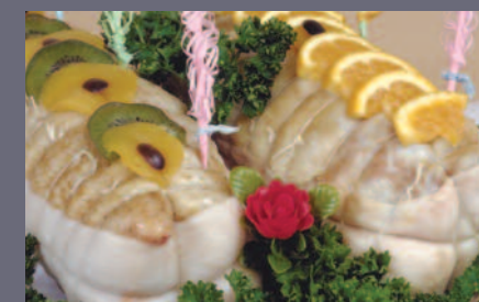
Rôti de Canard à l'orange