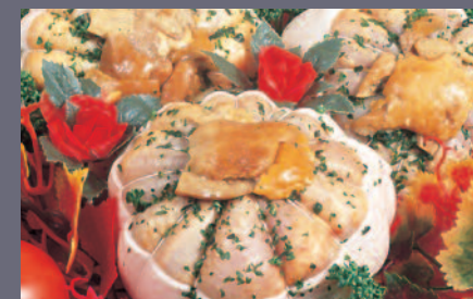
Melon de Pintade aux Cèpes