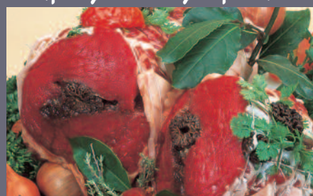
Rôti de bœuf aux morilles et foie gras