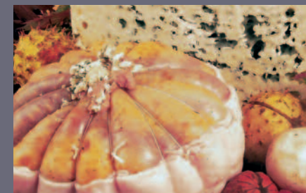
Melon de Pintade au Roquefort