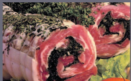
Rôti d'Agneau Périgourdin