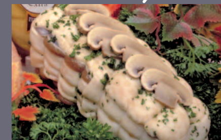
Rôti de Canard Forestier