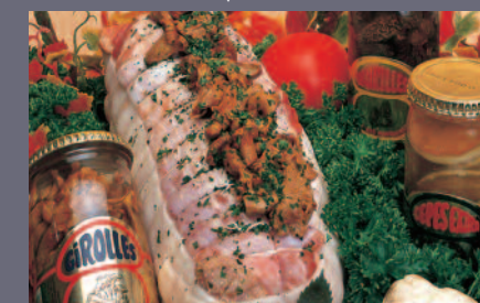
Rôti de Chapon aux Trois Champignons