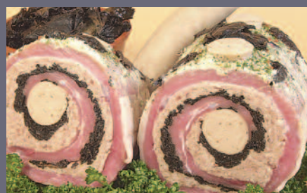
Veau au Boudin Blanc et Champignons