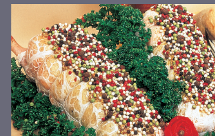
Rôti de Canard au Poivre Vert