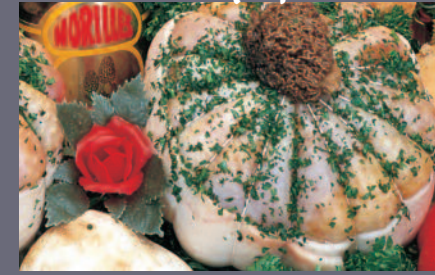
Melon de Pintade aux Morilles