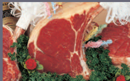
Côte de Bœuf