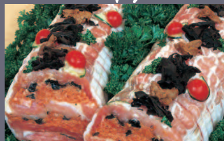
Rôti de Veau aux ris de veau et morilles