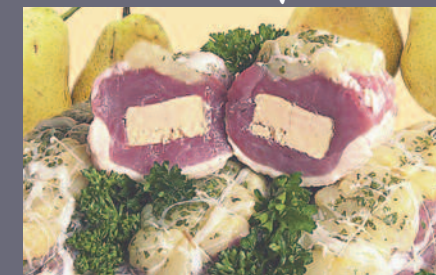
Rôti de magret Canard Foie Gras et pommes