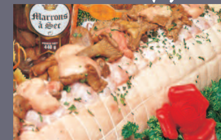
Rôti de Chapon Bressan