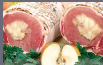
Rôti de Porc aux Pommes