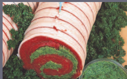
Rôti de bœuf Maître d'Hôtel