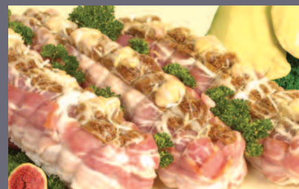
Filet mignon foie gras et figes